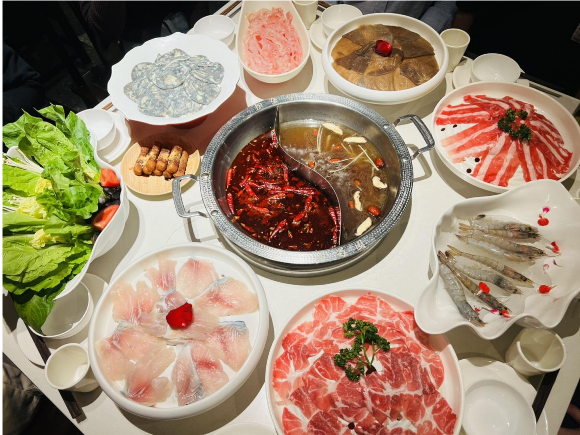
ค่ำ รับประทานอาหารค่ำ ณ ภัตตาคาร (มีที่ 9) *เมนูพิเศษ สุกี้หมาล่าเสฉวน